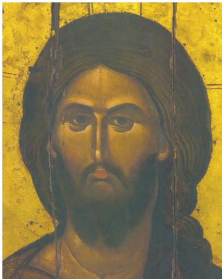
Mântuitorul Iisus Hristos (icoană, Muntele Athos, sec. XVIII)

„Biserica păstrează și transmite descoperirea dumnezeiască în Sf. Scriptură și Sf. Tradiție. În Sf. Scriptură, cuvântul lui Dumnezeu s-a transmis prin inspirația Sfântului Duh, iar în Sf. Tradiție, prin supravegherea și călăuzirea Aceluiași Duh Sfânt.”