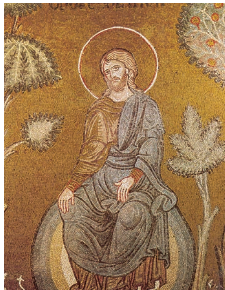
Ziua odihnei (mozaic bizantin, sec. XI)

Păcatul influențează și relațiile între oameni. După căderea în păcat, omul devine egoist, căutând cu orice preț afirmarea sinelui. Păcatul afectează și relația omului cu lumea; ea nu mai este o icoană prin care Dumnezeu poate fi contemplat, ci un obiect material supus exploatarei sale egoiste.