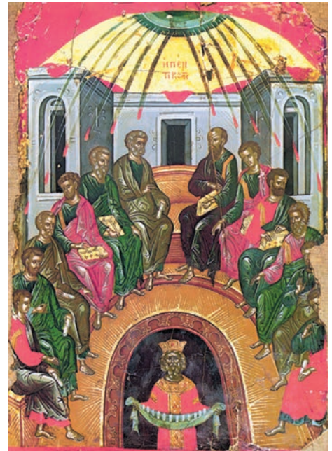
Pogorârea Duhului Sfânt (icoană bizantină, Muntele Athos, sec. XV)

„De la Duhul Tău, unde mă voi duce? Iar de la fața Ta, unde voi fugi? De mă voi pogori în iad, Tu ești de față; de-mi voi lua aripile din lumina zorilor și-n marginea mării mă voi sălășlui, chiar și acolo mâna Ta mă va îndruma și dreapta Ta mă va ține.” (Psalmul 138, 7-10)