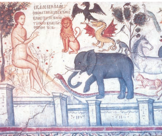
Adam numind animalele (frescă de Teofan Cretanul, sec. XVI)

„Nu există decât o idee supremă: că sufletul omenesc e nemuritor; toate celelalte idei profunde prin care trăiesc oamenii nu sunt decât prelungirea ei.”