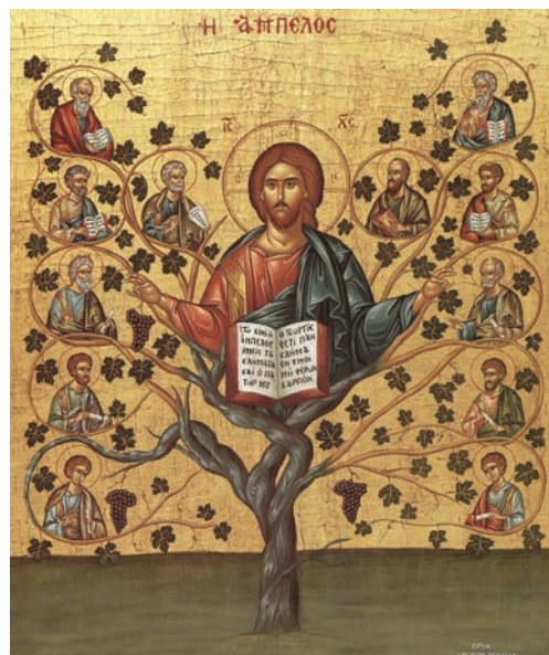
Iisus Hristos și Sfinții Apostoli (icoană în stil bizantin, sec. XIX)