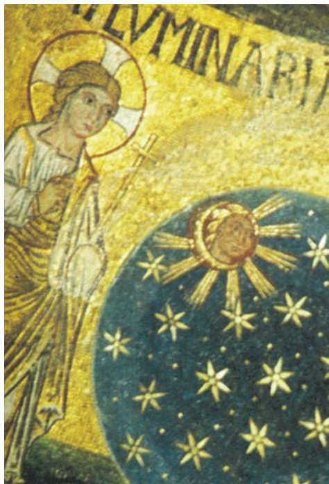
Crearea soarelui, lunii și stelelor (mozaic, Bazilica San Marco, Veneția, sec. XII)