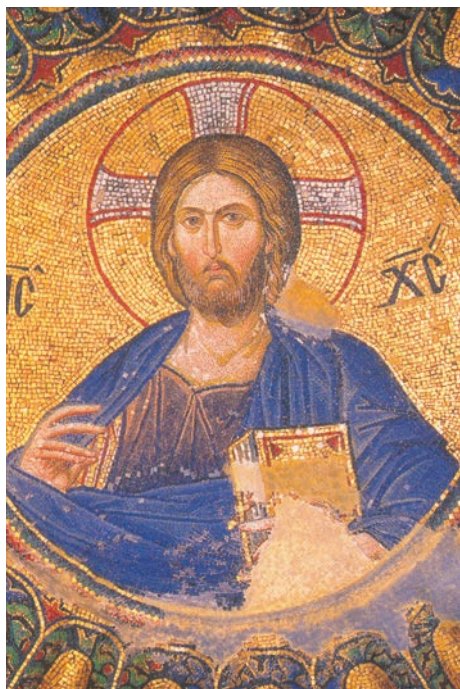
Fiul lui Dumnezeu – cuvântul întrupat (mozaic, Mănăstirea Chora, Constantinopol, sec. XIV)

„Nu există cunoaștere valabilă fără Dumnezeu – asta aflăm din Geneză. Păcatul e tentativa creaturii de a cultiva cunoașterea independent de autoritatea Creatorului. De aceea, acest păcat nici nu poate fi răscumpărat decât prin gestul, de o divină vehemență, al Întrupării. (...) Cunoașterea devine o persoană. Și Persoana aceasta spune, pentru surzii și smintiții de tot soiul: Eu sunt calea, Eu sunt adevărul, Eu sunt viața. Numai prin Mine accesul la cunoaștere e răsplătit prin adevăr și viață. Fără de Mine cunoașterea duce la eroare și moarte. (...) Euharistia, ca împărtășire cu trupul lui Dumnezeu, e singurul fel potrivit de a mușca din Adevăr și de a răscumpăra astfel mușcătura greșită a păcatului originar.”