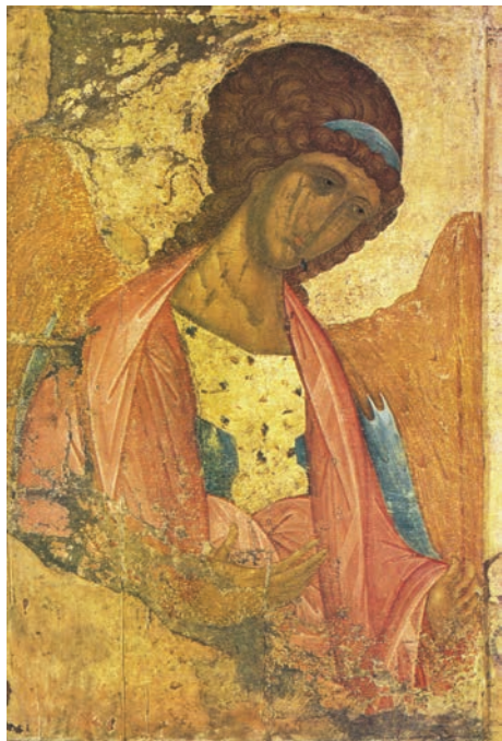
Sfântul Arhanghel Mihail (icoană, Andrei Rubliov, sec. XV)

„Pentru că întru El au fost zidite toate, cele din ceruri și de pe pământ, cele văzute, și cele nevăzute, fie Tronuri, fie Domnii, fie Începătorii, fie Stăpânii. Toate prin El și pentru El s-au zidit și El este mai înainte decât toate, și toate întru El se țin împreună.”