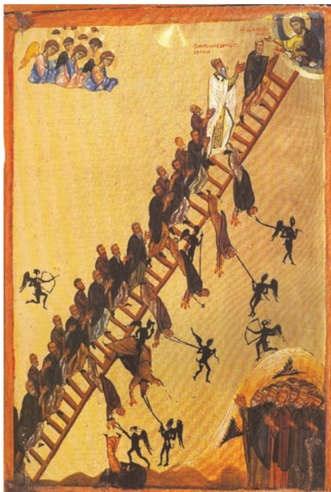
Scara Raiului (icoană, Muntele Sinai, sec. XII)

„Să nu disprețuim mântuirea noastră și să nu ne îndreptățim păcatele prin diferite pricini, spunând că în timpurile de azi nimeni nu mai poate ajunge la sfințenie. Totul este posibil acum, ca și în vechime și numai voința singură ne poate urca la acele înălțimi. Să pregătim voința. Dumnezeu este gata să ne îndumnezeiască, dar numai cu consimțământul nostru și nu contra voinței noastre. Iar noi fugim ca niște lași, respingând această fericire.”