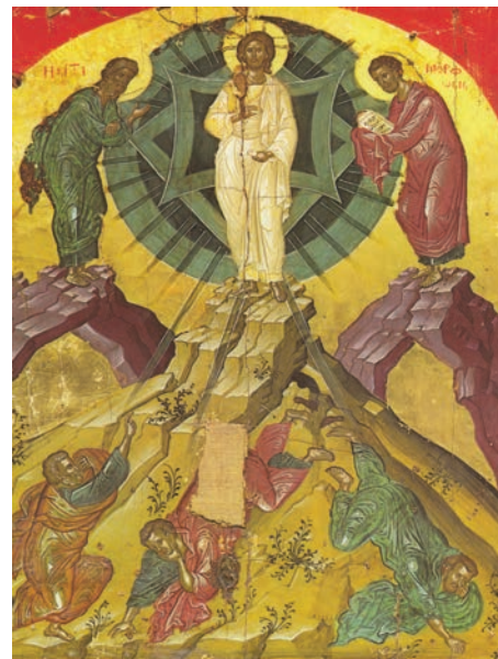
Schimbarea la față (frescă de Teofan Cretanul, Mănăstirea Stavronichita, Muntele Athos, sec. XVI)