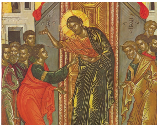
Toma atingând coasta Mântuitorului (frescă de Teofan Cretanul, Mănăstirea Stavronichita, Muntele Athos, sec. XVI)

Sfinții Apostoli, deși s-au arătat, inițial, neîncrezători în Învierea Domnului, au ajuns să se convingă atât de puternic de acest adevăr, încât au murit propovăduindu-l.