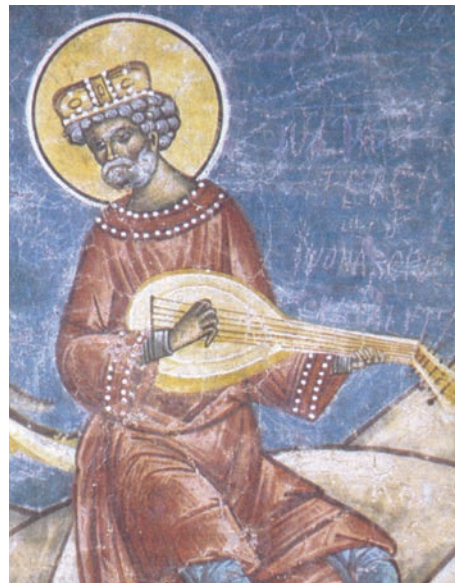
Prorocul David (detaliu frescă, Mănăstirea Voroneț, sec. XV)

Prin descoperirile din perioada Vechiului Testament, lumea a fost pregătită pentru primirea lui Iisus Hristos, Fiul lui Dumnezeu, ca Mântuitor al întregii lumi. Sf. Apostol Pavel scrie: „În multe rânduri și în multe feluri grăindu-le Dumnezeu părinților noștri prin profeți, în zilele acestea de pe