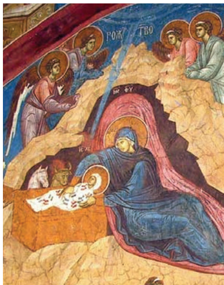
Nașterea Domnului (frescă, Mănăstirea Decani, sec. XIV)

„Suntem veșnic ispitiți a uita că de la trecerea Domnului Hristos prin lume, ontologic trăim, ne mișcăm și suntem într-o cu totul nouă ordine spirituală. Este un adevărat nou Univers spiritual acela în care respirăm noi astăzi și nu-i un lucru fără importanță dacă suntem sau nu conștienți de această adâncă realitate.”