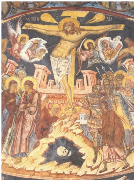
Răstignirea lui Iisus (frescă, Mănăstirea Probota, sec. XVI)

„Fiul Omului n-a venit să I se slujească, ci El să slujească și să-Și dea viața răscumpărare pentru mulți.” (Matei 20, 28)