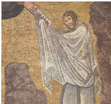
Moise primind tablele Legii (mozaic, Muntele Sinai, sec. VI)