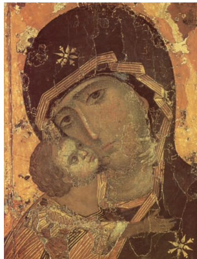
Maica Domnului din Vladimir (icoană, Rusia, sec. XII)