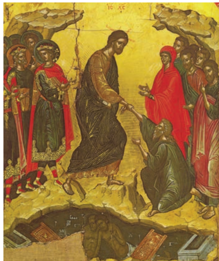
Învierea lui Hristos (frescă de Teofan Cretanul, Mănăstirea Stavronichita, Muntele Athos, sec. XVI)

„Nimeni să nu se tânguiască pentru păcate, că iertarea a strălucit din mormânt. Nimeni să nu se teamă de moarte, că ne-a slobozit pe noi moartea Mântuitorului (...) Unde-ți este, moarte, boldul? Unde-ți este, iadule, biruința?”