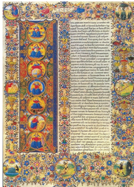
Sfânta Scriptură – ediție în limba latină (manuscris medieval cu miniaturi)

„Dumnezeu S-a făcut cunoscut, atât cât ne este cu putință să-L înțelegem, mai întâi prin lege și prin profeți, iar în urmă prin Fiul Lui, Unul născut, Domnul și Dumnezeu și Mântuitorul nostru Iisus Hristos. Pentru aceea primim, cunoaștem și cinstim toate cele predate nouă prin lege, prin profeți, prin apostoli și prin evangheliști și nu cercetăm nimic mai mult decât acestea.”