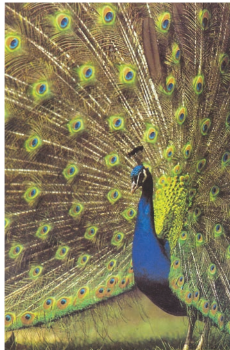
Creția mâinilor lui Dumnezeu: „Și a văzut Dumnezeu toate câte făcuse: și iată erau foarte frumoase” (Facere I, 31)

Ziua a V-a. Dumnezeu a făcut viețuitoarele din apă și din văzduh . Printr-o interpretare forțată, evoluționismul consideră că speciile derivă unele din