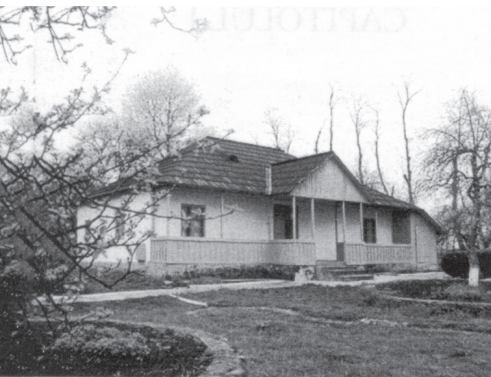
La maison parentale de Liveni, où est né l'artiste, aujourd'hui musée