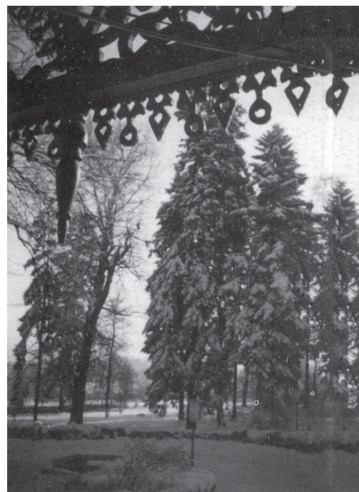
La cour de Tescani