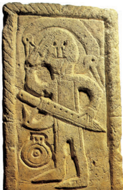
Alamanii și bavarii

De-abia în jurul anului 480 francii vor ajunge în prim plan: căpetenia unuia dintre aceste grupuri, Clodoveu, a reușit să îi unească sub conducerea sa pe salieni și a început o îndelungată politică de expansiune în urma căreia a reușit să controleze aproape întreaga Galie. Galo-romanii din zona Parisului au fost primii care au căzut sub puterea francă după învingerea căpeteniei lor, Siagrius, în bătălia de la Soissons. Mai târziu, alamanii și turingienii, învinși la Tolbiac, și-au văzut întreruptă expansiunea către sud și au fost nevoiți să recunoască suveranitatea francă. Ultimii învinși vor fi vizigoții, care vor pierde controlul asupra centrului și sudului Galiei și care vor părăsi țara după înfrângerea lui Alaric al II-lea în bătălia de la Vouillé. Doar burgunzii s-au menținut departe de conflict, grație unui pact semnat între regele Gundabald și Clodoveu, garantat de căsătoria monarhului franc cu o prințesă burgundă, Clotilda. Sub influența acesteia va accepta Clodoveu creștinarea și, odată cu el, o bună parte din popor va trece la noua confesiune. Această strategie i-a atras simpatia și acordul galo-romanilor și va fi hotărâtoare în lupta împotriva vizigoților arieni.