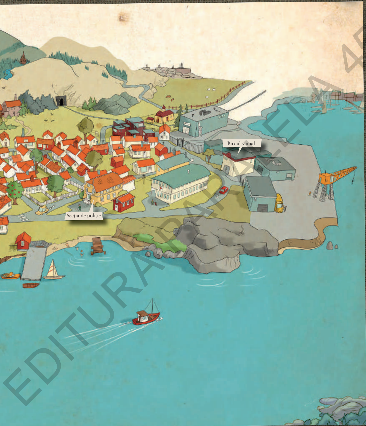
Secția de poliție