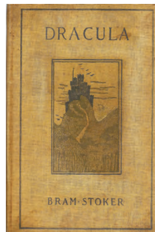
Coperta primei ediții americane, publicată în 1899.

Branul este situat în Transilvania, nu departe de vechea frontieră cu Valahia, între Munții Bucegi și Piatra Craiului. Legenda spune că cetatea de la Bran ar fi fost ridicată după 1212 de cavalerul teuton Dietrich, de unde a luat și denumirea de Dietrichstein , păstrată pentru o lungă perioadă. Din 1225 a trecut în stăpânirea regilor Ungariei. După alungarea cavalerilor teutoni din Țara Bârsei, cetatea, care inițial fusese construită din lemn, avea să fie reclădită din piatră de către sași, în jurul anului 1277. Aceștia vor numi