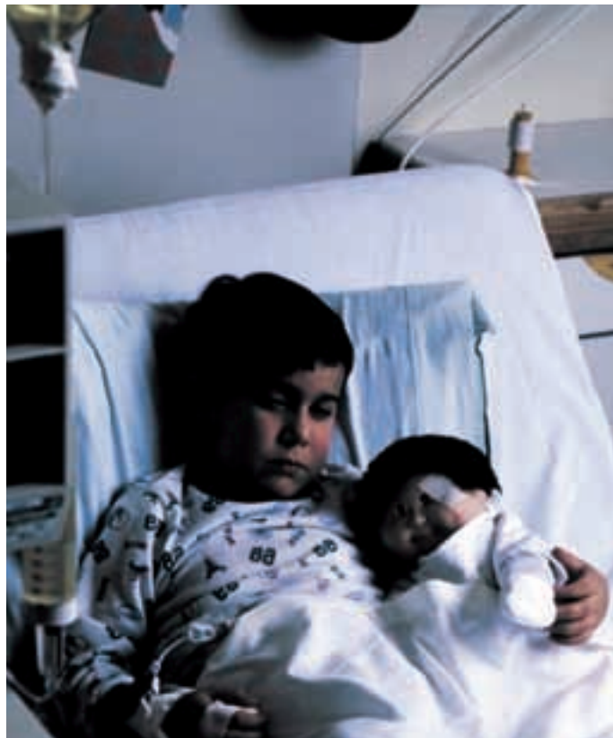
Unii copii cu oreion dezvoltă meningită virală. Majoritatea cazurilor de meningită cauzată de oreion sunt blânde, dar necesită spitalizare în vederea monitorizării.

Țesutul mamar se poate inflama. Această afecțiune, cunoscută drept mastită, apare la fete, dar și la băieți, provocând