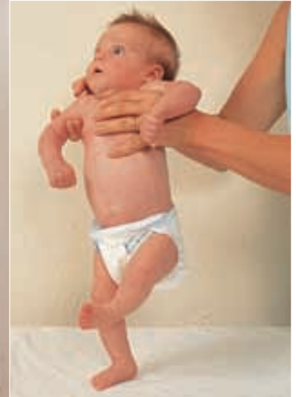
Presiunea plantară determină întinderea instinctivă a piciorului. Acest lucru este ușor de demonstrat la un bebeluș mai mic de șase luni.

TESTAREA REFLEXELOR Reflexul apucării sau al strângerii poate fi provocat prin atingerea palmei bebelușului cu un deget. Această acțiune îl determină să apuce degetul atât de strâns, încât îl poate mișca. Deși acest lucru nu are vreun uz practic pentru omul modern, le era probabil de folos strămoșilor noștri cu milioane de ani în urmă. O apucare puternică, instinctivă este cu siguranță folositoare unui pui de maimuță care se agată de spatele mamei. „Reflexul tonic asimetric al gâtului” implică așezarea bebelușului pe spate; când capul copilului este întors la 90 de grade la dreapta sau la stânga, brațul și piciorul de pe aceeași