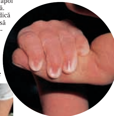
Reflexul de apucare este întâlnit la copii până la vârsta de patru luni. Acest reflex surprinzător de puternic indică faptul că sistemul nervos central funcționează corect.

Reflexele sunt foarte evidente în stadiile finale, dar nu sunt suficient de precise pentru a fi folosite ca test în diagnosticarea vreunei boli. Acestea pot fi doar semnul unui creier care îmbătrânește.