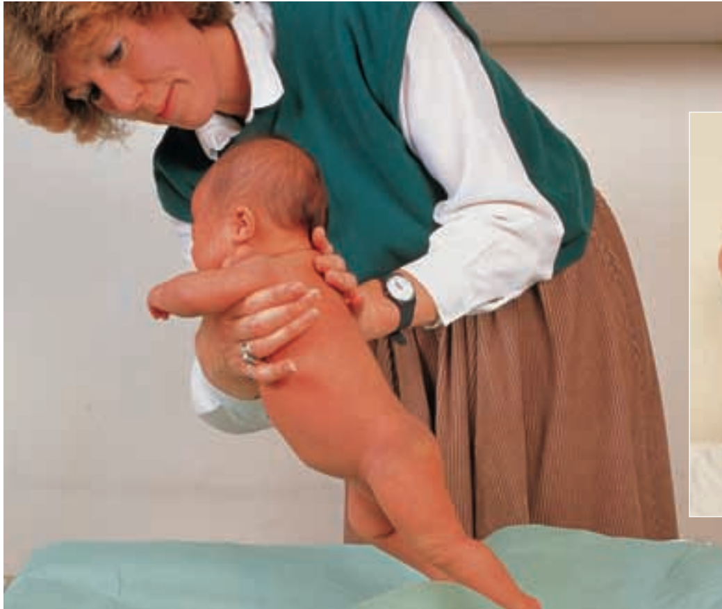
Reflexul de mers este stimulat prin așezarea bebelușului cu picioarele pe o masă și aplecarea la 10–20° înainte. Această reacție se pierde atunci când copilul dobândește controlul voluntar.